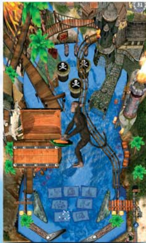
Pirates Of The Sea