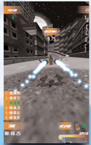
Ultimate Battle Racer